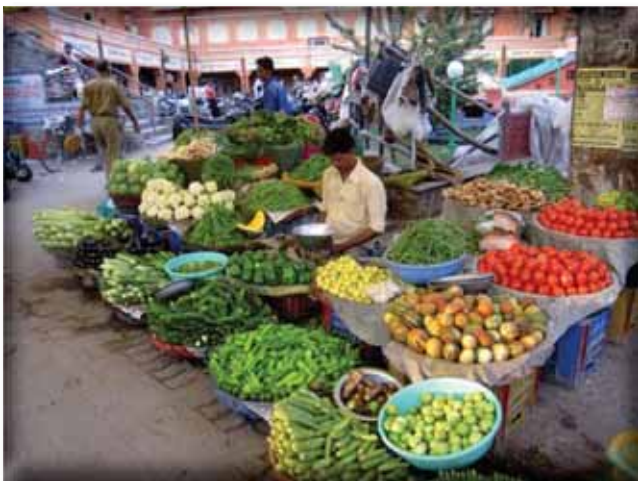
✓ Tržnica u Jaipuru

U očekivanju posjeta Taj Mahalu, jednom od sedam svjetskih čuda, u Agri, unaprijed smo ostajali bez daha. Veliki mogul Džahan-šah dao je 1631. godine sagraditi ovaj mauzolej u čast svoje voljene žene Mumtaz Mahal, preminule godinu dana prije. Taj