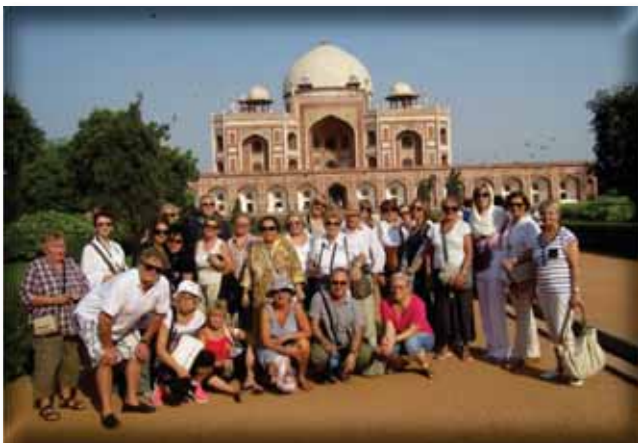
✓ Ispred Humajunove grobnice u Delhiju

Naše prvo odredište bio je upravo Delhi, te smo zbog njegove veličine upoznali samo mali, stari dio grada, najveću indijsku džamiju - Jama Masjid te Crvenu utvrdu, odnosno citadelu iz 17. stoljeća koju je dao izgraditi car Shah Jahan. Memorijal Mahatmi Gandhiju – Rajghat - također je jedna od nezaobilaznih znamenitosti. Sljedeći dan put nas je odveo u Jaipur, najbogatiju kulturnu destinaciju Indije. To je glavni grad savezne države Rajasthan, izgrađen krajem 18. stoljeću. Jaipur je planski građen, prošaran širokim avenijama kojima dominira ružičasta boja. Sljedeći dan otišli smo do utvrde Amber koja je smještena na brdu, te smo dio puta jahali na slonovima. Razgledali smo hram božice Kali Jai Mandir, predivne palače i vrtove, gradsku palaču (bivša kraljevska rezidencija, a danas etnografski muzej) i opservatorij Jantar Mantar koji datira iz 18. stoljeća. Ovdje se nalazi bogata zbirka astronomskih instrumenata izrađenih od mramora, vrt s 30-metarskim sunčanim satom i znamenita Hawa Mahal („palača vjetrova“). Nakon cjelodnevnog razgledavanja, vožnja rikšama u večernjim satima bila je pravi doživljaj!