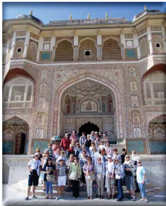
✓ Utvrda Amber u Jaipuru - ispred Ganeshovih vrata

Mahal, izgrađen od bijelog mramora i protkan elementima perzijskih, indijskih i islamskih arhitektonskih stilova, smatra se vrhunskim ostvarenjem mogulske arhitekture. Od 1983. godine na UNESCO-voj je listi svjetske kulturne baštine, opisan kao „dragulj islamske umjetnosti“ u Indiji i jedan od univerzalno priznatih remek-djela svjetskog nasljeđa. Gradnja je trajala 21 godinu. Iako je bijela kupola mramornog mauzoleja najpoznatija arhitektonska komponenta, Taj Mahal je zapravo integrirani kompleks struktura. Tisuće umjetnika i radnika sudjelovalo je u izgradnji koja je započela oko 1632. i završena 1653. godine.